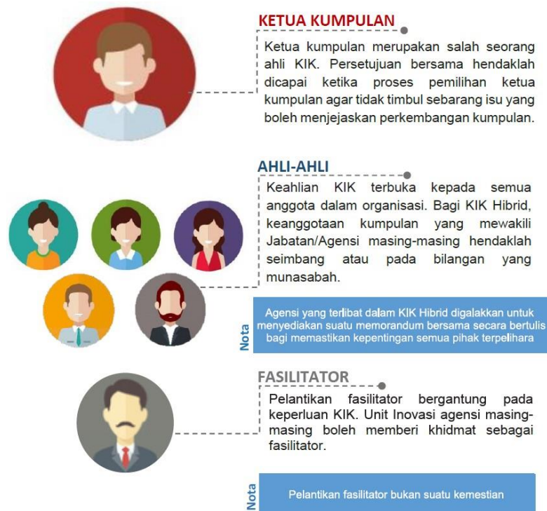
Rajah 4: Komponen KIK

KIK mengandungi komponen-komponen yang ditunjukkan pada Rajah 4 .