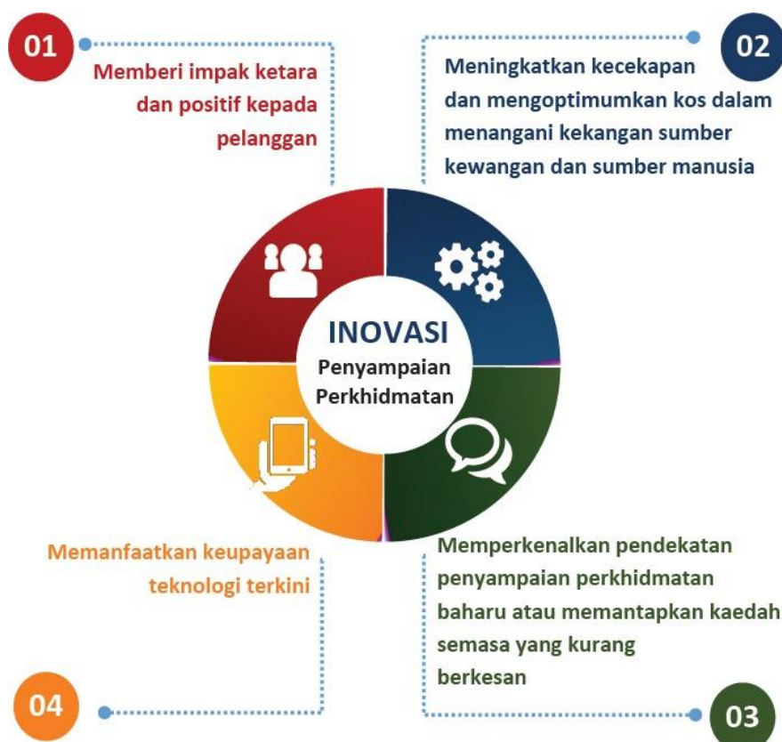
Rajah 2: Ciri-ciri utama Inovasi Penyampaian Perkhidmatan

Ciri-ciri utama inovasi penyampaian perkhidmatan ditunjukkan pada Rajah 2 berikut: