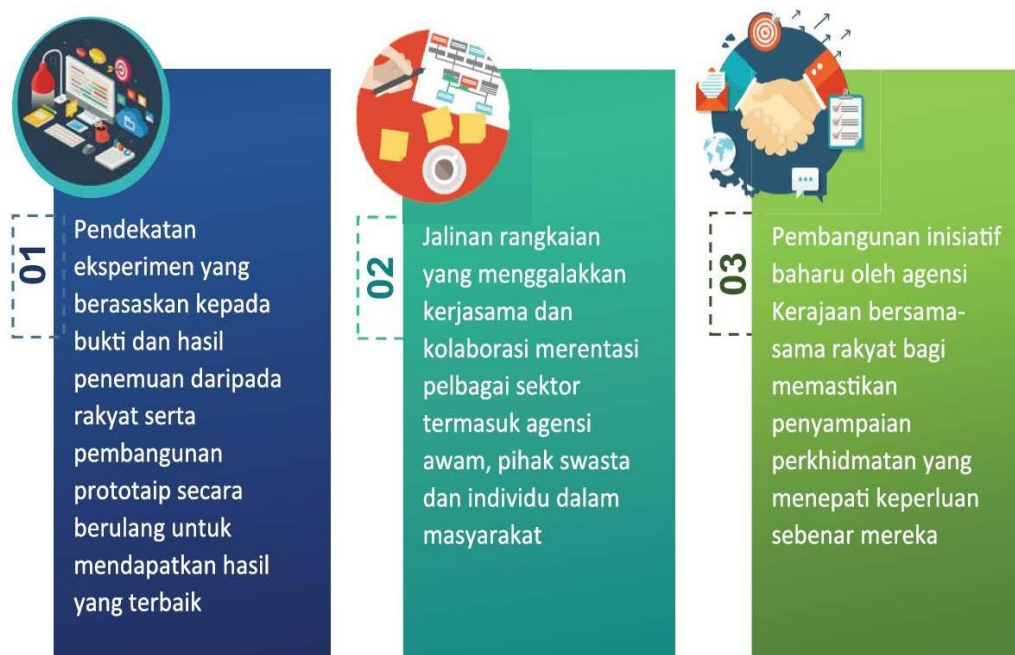
Rajah 1: Ciri-ciri utama Inovasi Sosial

Ciri-ciri utama inovasi sosial ditunjukkan pada Rajah 1 berikut: